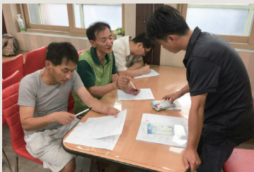
일자리 참여자 모집을 위한 사업설명회

앞으로 끊임없이 노력하여 한분 한분의 마음을 헤아리며 눈높이에 맞는 일 자리를 알선하여 사회에 복귀할 수 있도록 최선을 다하겠습니다.