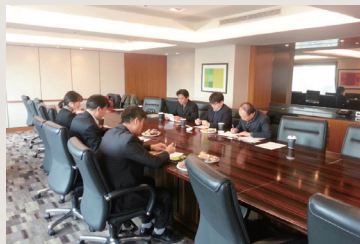
대형호텔 일자리 발굴을 위한 업무협의